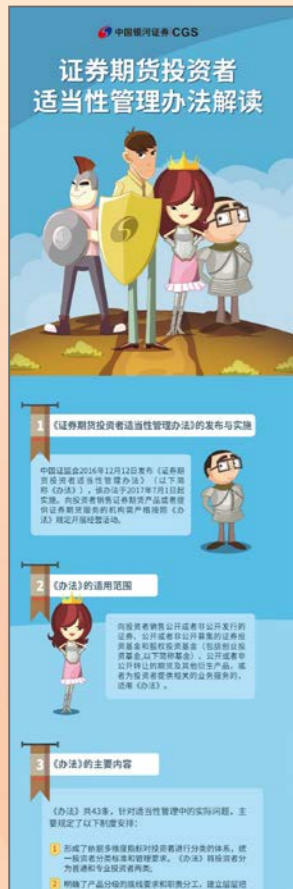
以图文形式帮助投资者解读《证券期货投资者适当性管理办法》

为充分发挥公司互联网优势，银河证券投教基地在立体化投教服务体系方面，以网站平台为服务基础，设置六大功能模块和三大特色专区，实现了产品展示、信息检索、互动交流、资讯共享等功能；以自媒体平台为扩大服务渠道，发布形式多样的投教产品，增强与投资者的交流互动；以线下营业网点和公司统一客服热线为补充服务形式，为投资者提供面对面、7×24小时的一对一投教服务。同时，银河证券投教基地充分发挥公司专业化证券服务优势，在投教内容制作与传播方面，注重运用创新化、通俗化、娱乐化的方式，为投资者提供投教服务内容，与投资者进行广泛沟通和交流。制作“走心”原创产品；引入趣味互动游戏；举办线上线下丰富投教活动，寓教于乐，赋予投资者教育更多丰富性内容与多样化形式。做好投资者权益保护和教育工作是证券经营机构的责任和义务，银河证券投教基地将秉承公司“合规、创新、协同、服务”的企业文化，积极践行企业社会责任，不断探索、继续前行，运用智慧投教，努力将投资者教育和保护工作提高到新水平。