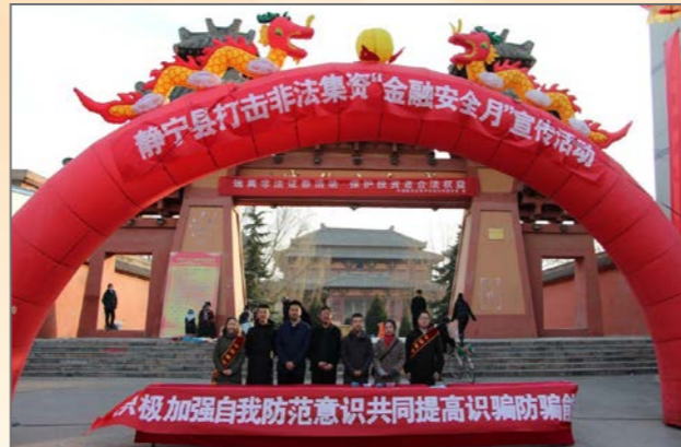
开展丰富多样投教活动，在定点帮扶贫困县举办打非宣传活动