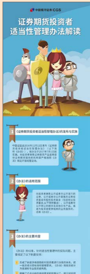
以图文形式帮助投资者解读《证券期货投资者适当性管理办法》

1 《证券期货投资者适当性管理办法》的发布与实施 2 《办法》的适用范围 3 《办法》的主要内容