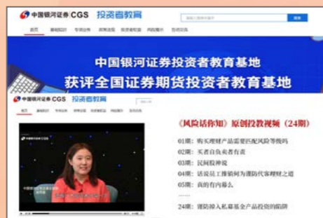
拍摄制作24期原创投教视频，讲解与投资者相关的经典案例

为充分发挥公司互联网优势，银河证券投教基地在立体化投教服务体系方面，以网站平台为服务基础，设置六大功能模块和三大特色专区，实现了产品展示、信息检索、互动交流、资讯共享等功能；以自媒体平台为扩大服务渠道，发布形式多样的投教产品，增强与投资者的交流互动；以线下营业网点和公司统一客服热线为补充服务形式，为投资者提供面对面、7×24小时的一对一投教服务。同时，银河证券投教基地充分发挥公司专业化证券服务优势，在投教内容制作与传播方面，注重运用创新化、通俗化、娱乐化的方式，为投资者提供投教服务内容，与投资者进行广泛沟通和交流。制作“走心”原创产品；引入趣味互动游戏；举办线上线下丰富投教活动，寓教于乐，赋予投资者教育更多丰富性内容与多样化形式。做好投资者权益保护和教育工作是证券经营机构的责任和义务，银河证券投教基地将秉承公司“合规、创新、协同、服务”的企业文化，积极践行企业社会责任，不断探索、继续前行，运用智慧投教，努力将投资者教育和保护工作提高到新水平。