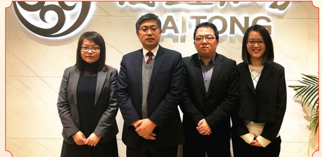
课题名称：证券公司高端客户服务组织管理模式研究（海通证券股份有限公司）