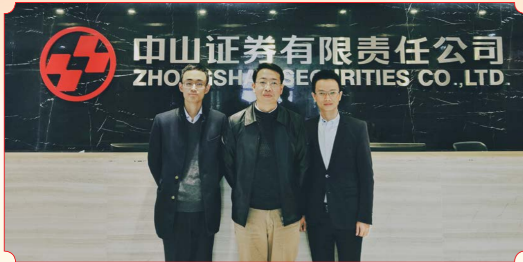
课题名称：公司债市场的风险预警与控制研究（中山证券有限责任公司）