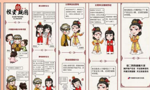
制作趣味投教产品，以漫画形式进行投资者风险提示