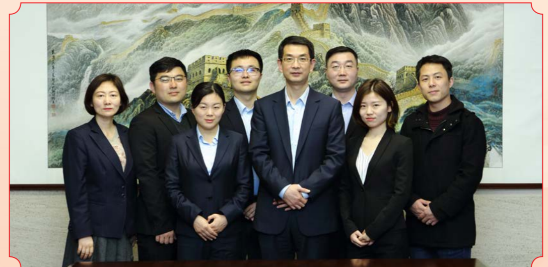
课题名称：金融科技引领下证券公司的商业模式重构及监管机制研究（申万宏源证券有限公司）