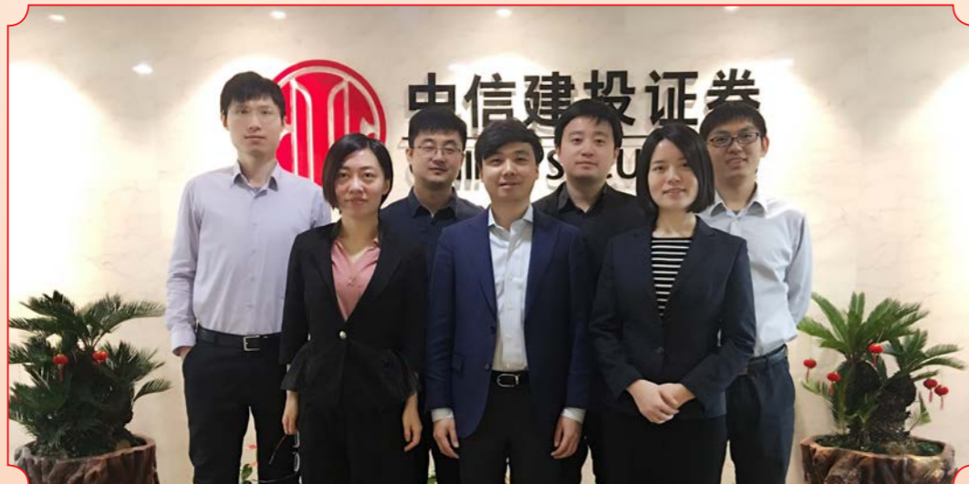
课题名称：股票质押回购业务的风险管理体系与处置实务研究（中信建投证券股份有限公司）