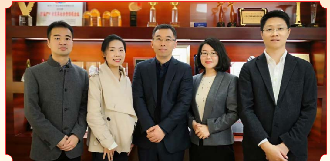
课题名称：国内券商财富管理业务模式研究（广发证券股份有限公司）